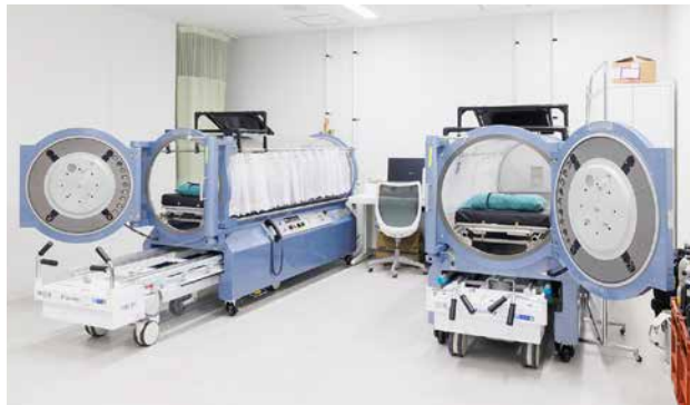
高気圧酸素治療装置