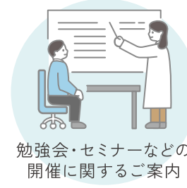
勉強会・セミナーなどの 開催に関するご案内