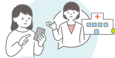
お問い合わせ対応