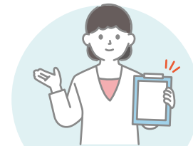
外来受診・検査予約