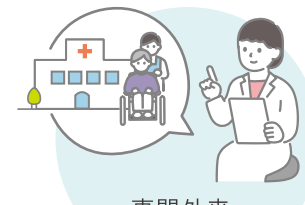
専門外来・ セカンドオピニオン外来の予約