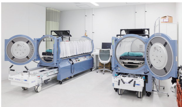
高気圧酸素治療装置