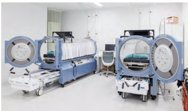
高気圧酸素治療装置